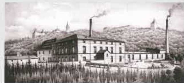
Hradecká lepenkárna (bývalá papírna) s elektrárnou, r. 1913