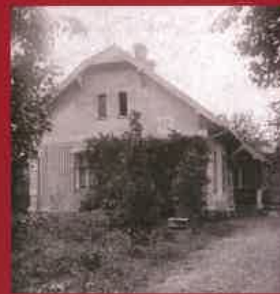
Dům zámeckého zahradníka, r. 1922