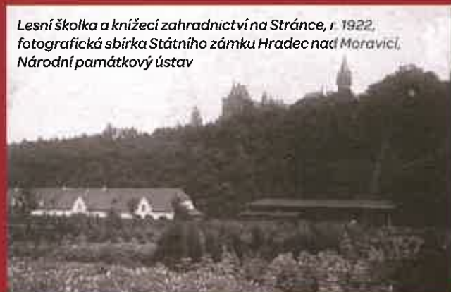
Lesní školka a knížecí zahradnictví na Stránce, r. 1922

Zámecké zahradnictví na Stránce tvořily v polovině 19. století, zelnářská zahrada, štěpnice (ovocný sad), zásobní zahrada pro stromy, keře a květiny pro zámecký park a rozlehlý dřevěný skleník pro pěstování ananasů a zeleniny.