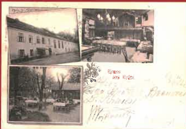
Budova pivovaru se společenským sálem, zahradní restaurací a kůzelnou na dobové pohlednici, r. 1905, archiv Petr Havlant

V současné době patří sklepení bývalého pivovaru do majetku Národního památkového ústavu.