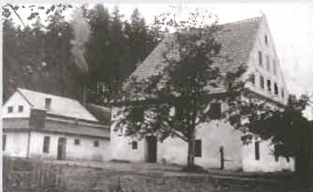
Budova elektrárny a správní budovy papírny (vpravo) v r. 1915. Vysoká šindelová střecha s půdním prostorem správní budovy sloužila původně k sušení vyrobených archů papíru

kteřá dodávala (jako první v Hradci) od r. 1908 elektrický stejnosměrný proud nejen na zámek a do budovy knížecí lesní správy, ale nově i mnohým majitelům nemovitostí v Podolí a v Hradci. V roce 1920 byl nájem lepenkárny vypovězen, její stroje byly prodány a odvezeny. V provozu však zůstala elektrárna, a to až do r. 1945, kdy byla při přechodu fronty značně poškozena a později v roce 1950 zcela odstraněna. Cihly ze zdemolovaných budov elektrárny byly použity na stavbu rodinných domů. Obytná budova bývalé Hofmannovy papírny krytá šindelem, se sušárnou v podkroví, byla zbořena až v roce 1966.