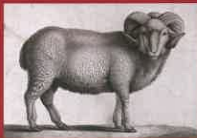
Plemenný beran typu merino na dobové litografii, 18. století

Rozsáhlý chov až 1200hlavého stáda zapříčinil v Hradci v 19. století opravdu překotný rozvoj soukenictví a předlácství. Hradecký soukenický cech se v 19. století oddělil od cechu opavského a ve 20. letech 19. století dosáhl počet jeho členů 80 osob. V Hradci vznikly zároveň dvě textilní manufaktury, z nichž v jedné po ukončení soukenické činnosti vznikla v roce 1862 továrna na výrobu železného zboží, předchůdce dnešní BRANO, a. s. Podomácká výroba byla postupně nahrazována od 40. let 19. století strojovou výrobou. Knížecí chov ovcí na hradeckém panství byl s generační výměnou postupně utlumován a zanikl definitivně v 60. letech 19. století. Chov ovcí kníže Lichnovských dnes připomíná pouze jediná původní budova ze čtyř kamenných budov dvora Stránka, před níž se právě nacházíte. Dvůr měl původně půdorys lichoběžníku a mimo dvou ovčinců zde byly ustájeny také krávy, tažní oslí a překvapivě i černá zvěř. V samostatném křídle dvora se nacházely byty drábo, hildačů zámeckého parku, zahradníků a obslužného personálu. Poslední křídlo dvora tvořila stodoila se dvěma mláty. Dnes je budova v majetku GroCredit, a. s., dceřině společnosti Opavské lesní, a. s.