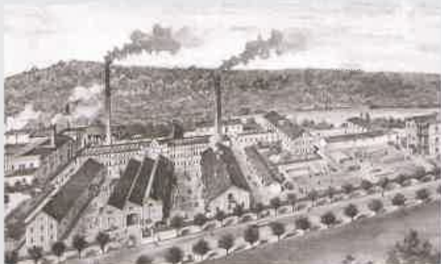
Branecké železáreny s mostárnou, r. 1905

ještě v 50. letech 20. století podobu dřevěné lávky pro pěší umístěné na několika pilířích. Lávka byla při jarním tání sněhu, a tehdy ještě neexistenci vodního díla Kružberk na řece Moravici, často ohrožována odchody ledu a na konci 50. let 20. století se již nacházela ve špatném technickém stavu. V roce 1962 ji proto nahradila již zmiňovaná jednopoplová kolmá lávka o délce 45,3 m. Konstrukce lávky byla zvolena jako visutá, s ocelovou mostovkou z válcovaných profilů zavěšenou na závěsech. Pylony lávky jsou rovněž ocelové, příhradové konstrukce. Autor návrhu lávky není bohužel znám.